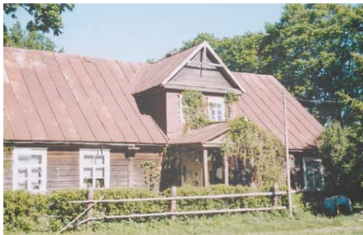
Prieš keletą dešimtmečių šiame pastate dar veikė Jokūbėliško pradinė mokykla.

Šis didokas statinys, esantis Anykščių seniūnijos Jokūbėliško kaime, – buvusi mokykla. Ir nors seniai čia nebekrykštauja mokių balsai, senoji mokykla ne vienam vyresnės kartos žmogui kelia nostalgiskus vaikystės prisiminimus.