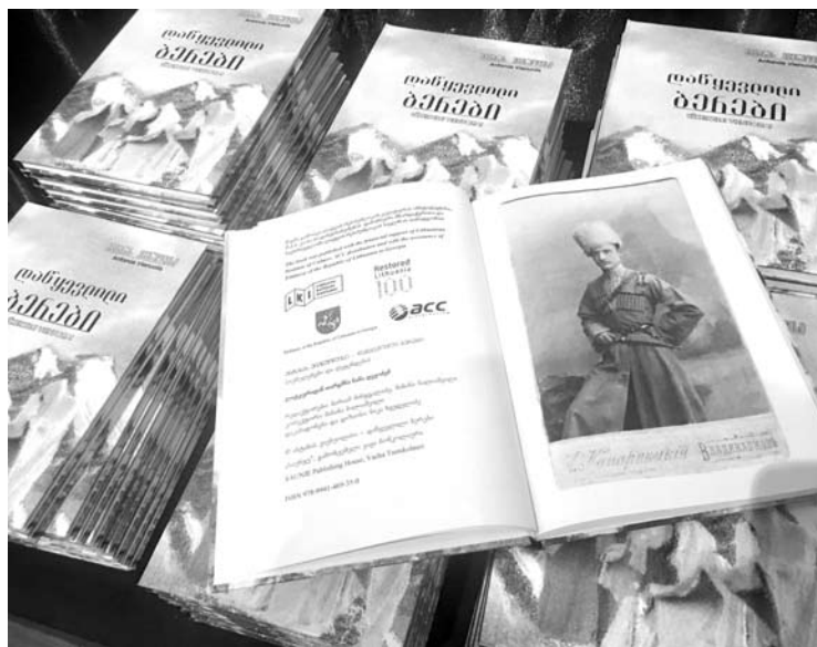
A. Vienuolio „Kaukazo legendos“ pernai buvo išleistos Tbilisyje kartvelų kalba.

A. Baranausko ir A. Vienuolio-Žukausko memorialinio muziejaus informacija