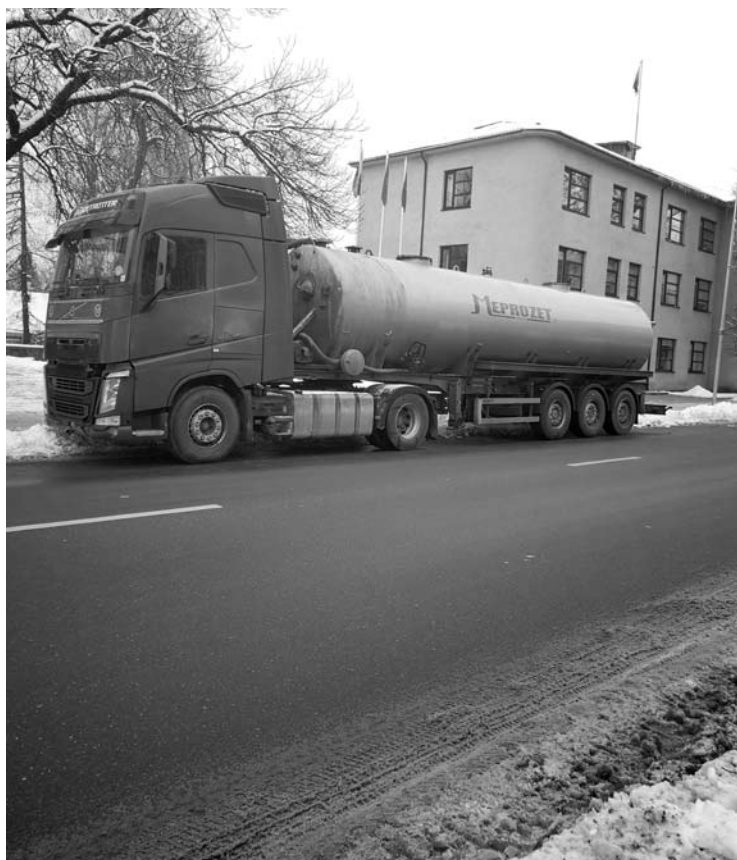
Pirmadienio, sausio 7-osios, rytą, tarp 9 ir 10 valandos, J. Biliūno gatvėje prie Anyškėčių savivaldybės administracijos pastato į staigiai stabdžiusį „Renault Laguna“ rėžėsi autocisterna.