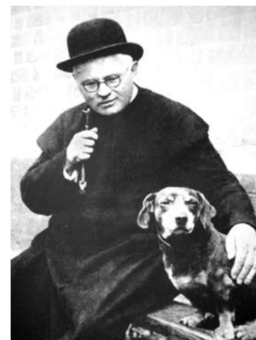
Idėją paminklui šia nuotrauka pasiūlė pats Juozas Tumas-Vaižgantas...

Tačiau architektai ir miesto valdžia šios vietos, kadaise paruoštos Vytauto Didžiojo paminklui tarsi ir pagailėjo Vaižgantui. Pasiūlė ir