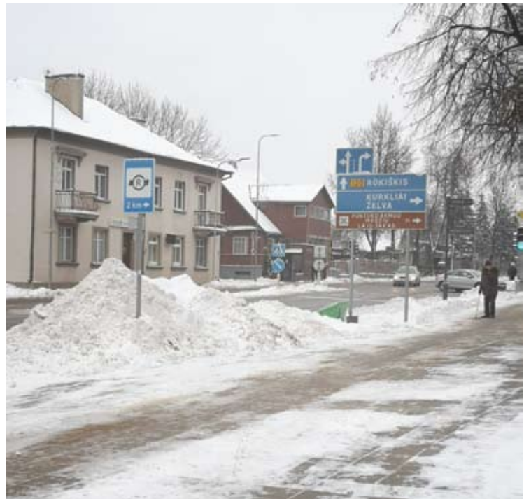
Sniegas Anykščių A. Baranausko aikštėje pirmadienį, sausio 7-ąją.