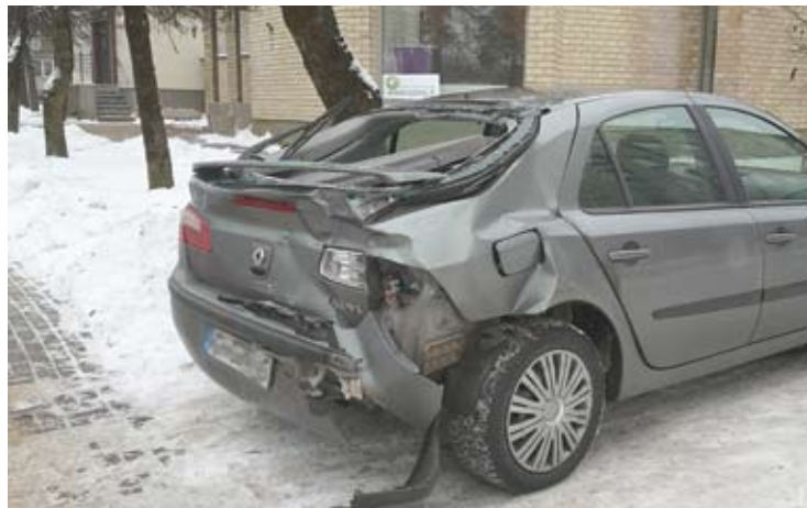
„Renault Laguna“ po kontakto su latvio autocisterna skaudžiai nukentėjo.

Penktadienį ir šeštadienį Anykščių rajone registruoti eismo įvykiai, per kuriuos nukentėjo žmonės. Šių abiejų avarių priežastis – vairuotojai nepasirinko saugaus greičio ir išslydo į priešingą eismo juostą.